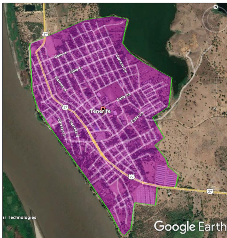
Ilustración 1 Área de Prestación Efectiva del Servicio de Acueducto Municipio de Tenerife

Del área de prestación efectiva del servicio de acueducto se excluyen las áreas o predios urbanizados definidos en el Decreto 1077 de 2015, o la norma que lo modifique, sustituya o adicione, que no tengan o no hayan culminado las obras de infraestructura de servicios públicos domiciliarios de acueducto y alcantarillado requeridos para su prestación, tales como: