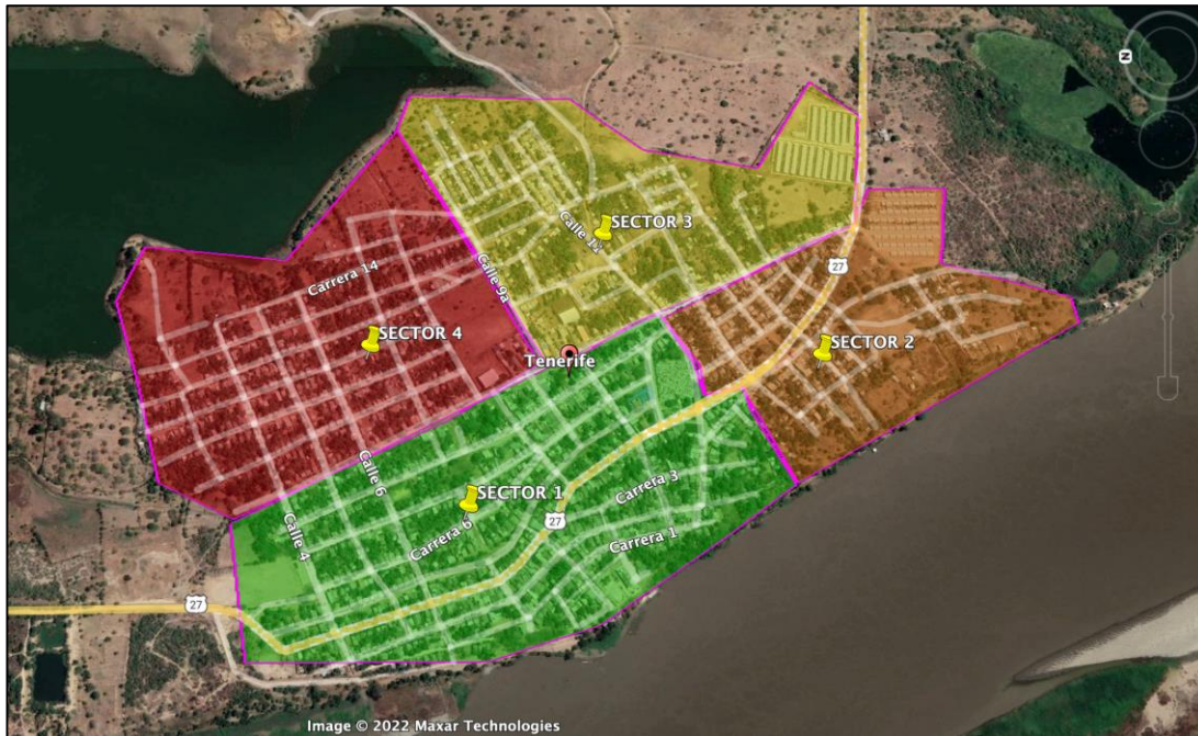
Tabla 3 esquema de prestación sectorizada.

El suministro de Aguas a área de prestación del Municipio de Tenerife se hace de manera simultánea mediante 4 sectores Hidráulicos con promedios de 17 horas/día.