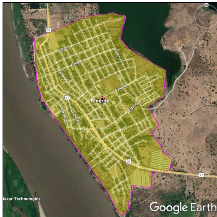
Ilustración 2 Área de Prestación Efectiva del Servicio de Alcantarillado Municipio de Tenerife

Del área de prestación efectiva del servicio de alcantarillado sanitario se excluyen las áreas o predios urbanizados definidos en el Decreto 1077 de 2015, o la norma que lo modifique, sustituya o adicione, que no tengan o no hayan culminado las obras de infraestructura de servicios públicos domiciliarios de acueducto y alcantarillado requeridas para su prestación, tales como: